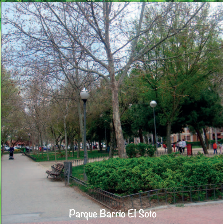
Parque Barrio El Soto