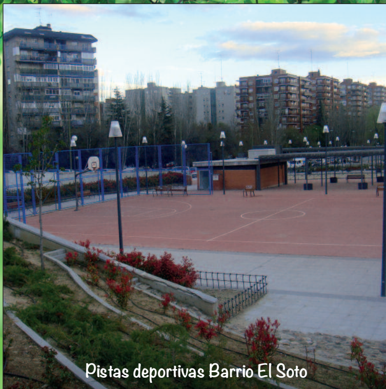
Pistas deportivas Barrio El Soto