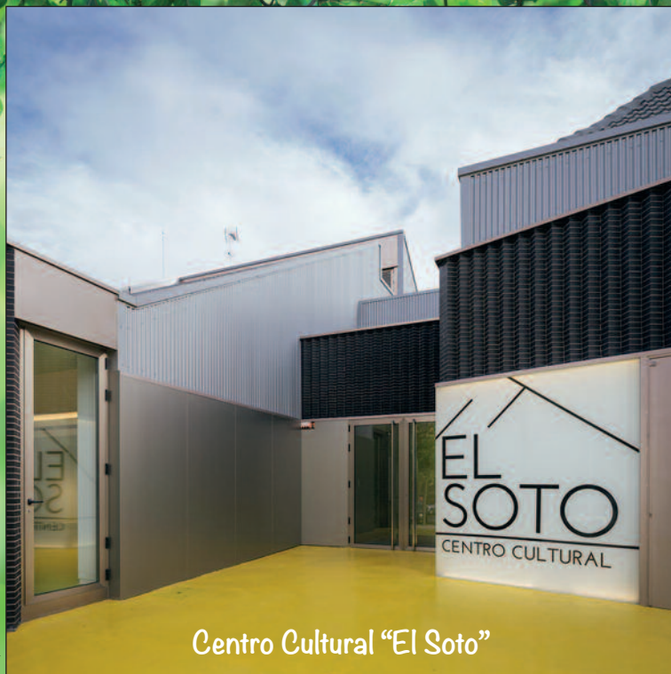
Centro Cultural "El Soto"