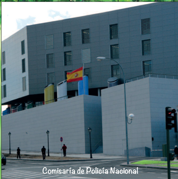
Comisaría de Policía Nacional