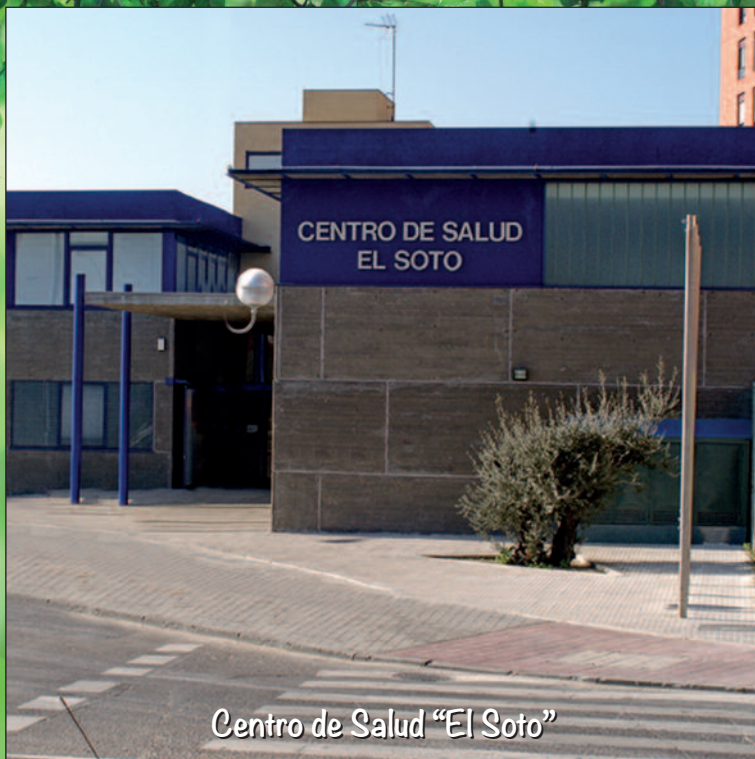
Centro de Salud "El Soto"