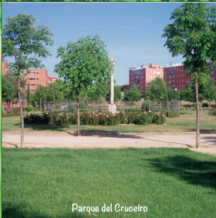
Parque del Cruceiro