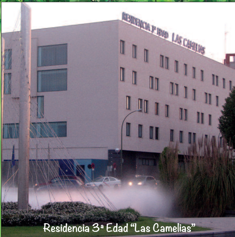
Residencia 3ª Edad "Las Camelias"