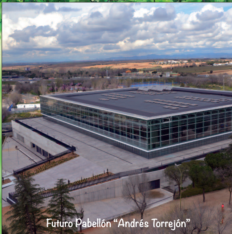
Futuro Pabellón "Andrés Torrejón"