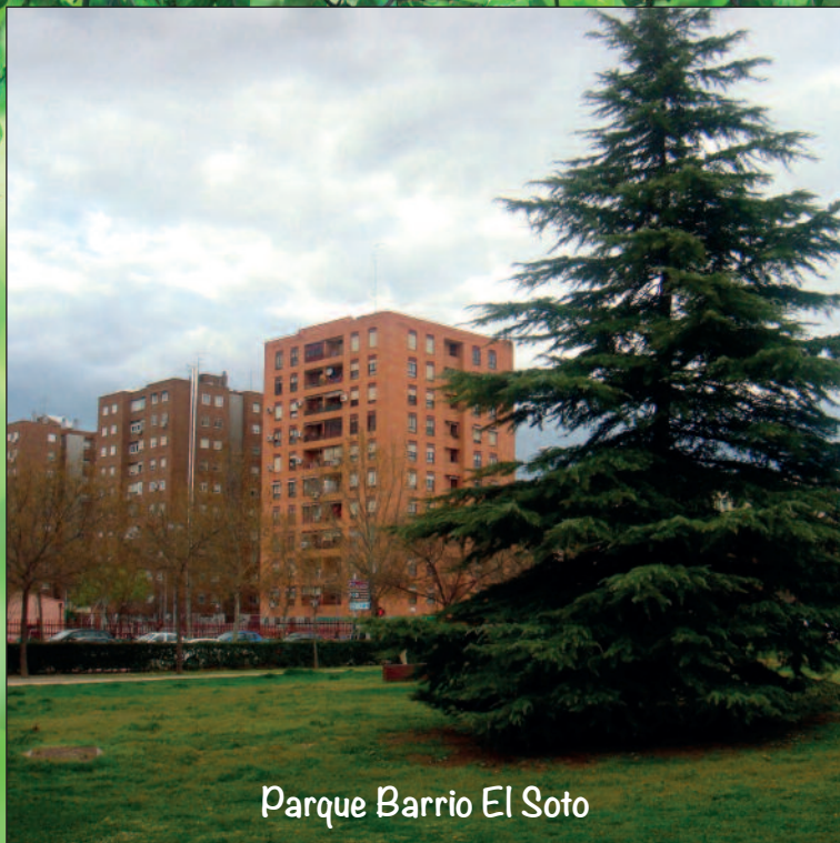
Parque Barrio El Soto