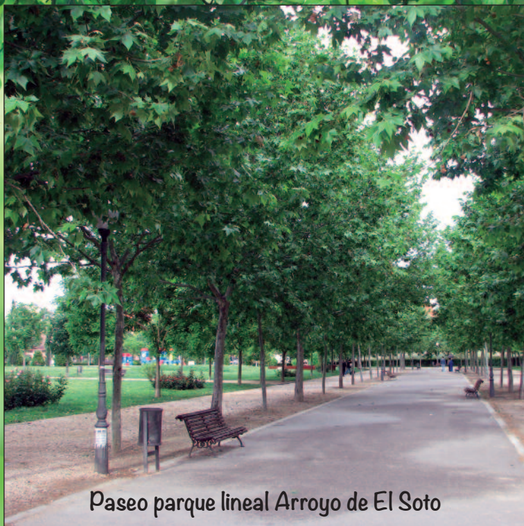
Paseo parque lineal Arroyo de El Soto