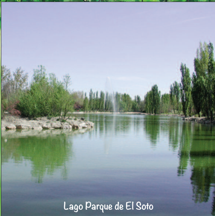
Lago Parque de El Soto